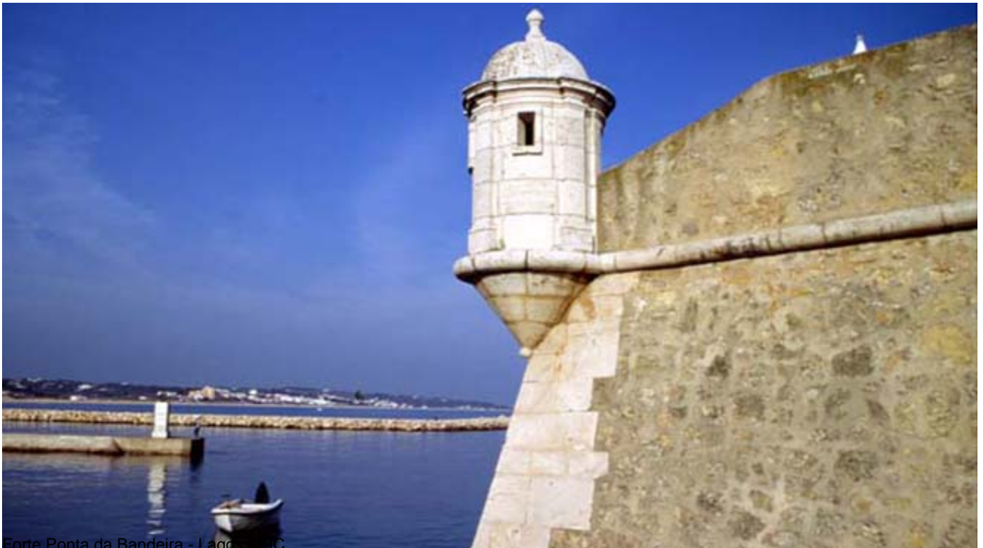
Forte Ponta da Bandeira - Lagos

海に向かって進むと、 マリーナ・デ・ラゴス[Marina de Lagos] (10)とを結ぶ歩行者橋のある デスコプリメントス通り[Avenida dos Descobrimentos] (8)に戻ってきます。非常に多くの船がマリーナに停泊しており、ポルトガルの旧キャラベル船を模したキャラベル・ボア・エスペレンサ[Caravela Boa Esperança] (9)の姿も見られます。外からも建物の外部の特徴などをご覧いただけますが、入口はアクセシブルではなく、中もスペースは狭く動き回ることが難しくなっています。マリーナには複数のレジャーエリアのほか、ポルトガルの海洋活動について知ることができるアクセシブルな蝋人形博物館[Museu de Cera dos Descobrimentos] (11)があります。