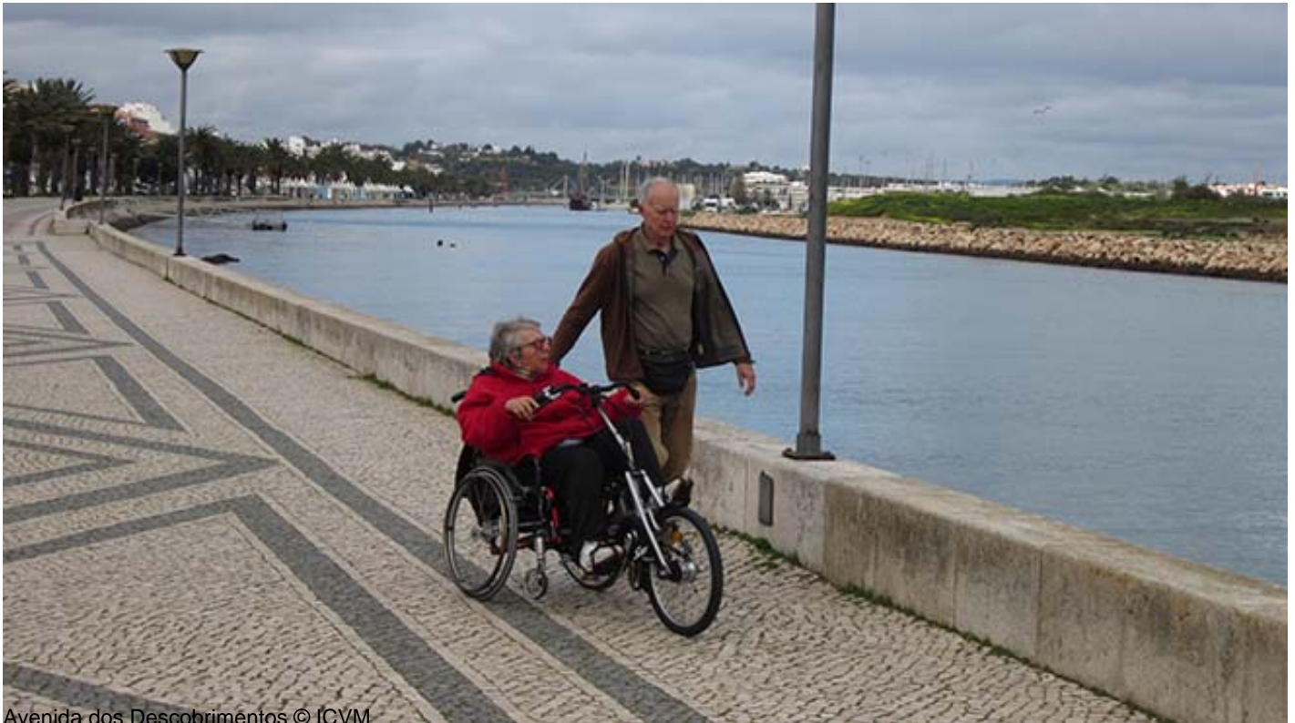
Avenida dos Descobrimentos

海に向かって進むと、 マリーナ・デ・ラゴス[Marina de Lagos] (10)とを結ぶ歩行者橋のある デスコプリメントス通り[Avenida dos Descobrimentos] (8)に戻ってきます。非常に多くの船がマリーナに停泊しており、ポルトガルの旧キャラベル船を模したキャラベル・ボア・エスペレンサ[Caravela Boa Esperança] (9)の姿も見られます。外からも建物の外部の特徴などをご覧いただけますが、入口はアクセシブルではなく、中もスペースは狭く動き回ることが難しくなっています。マリーナには複数のレジャーエリアのほか、ポルトガルの海洋活動について知ることができるアクセシブルな蝋人形博物館[Museu de Cera dos Descobrimentos] (11)があります。