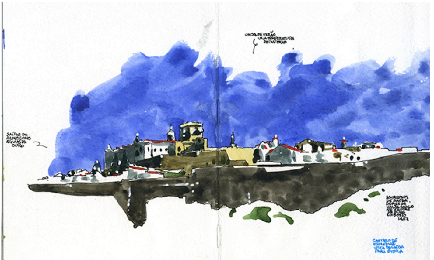
Vila Viçosa