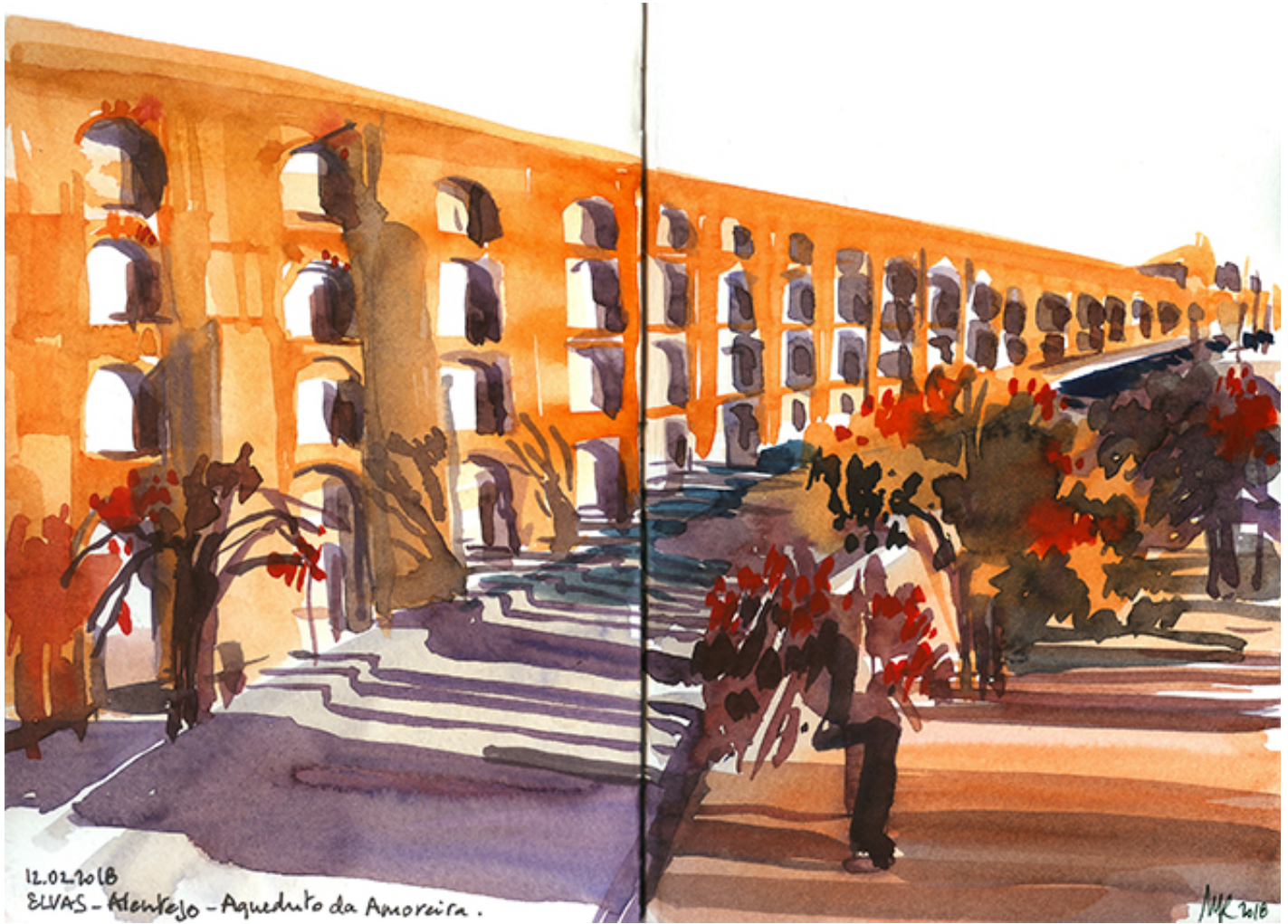
Campo Maior © João Moreno