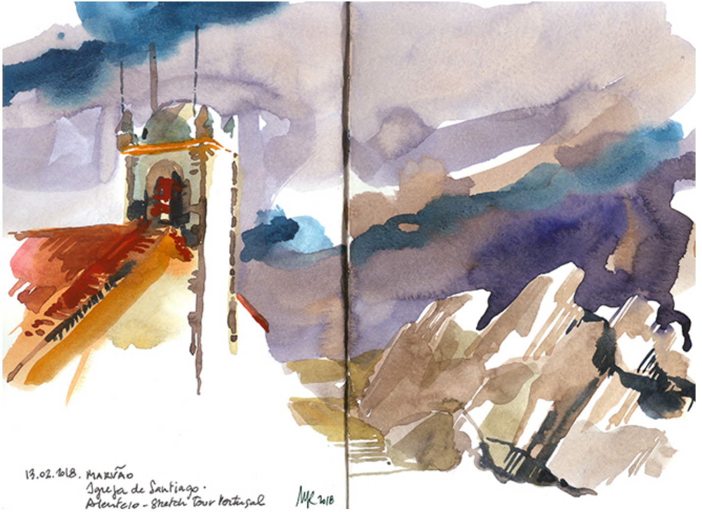
Castelo de Vide