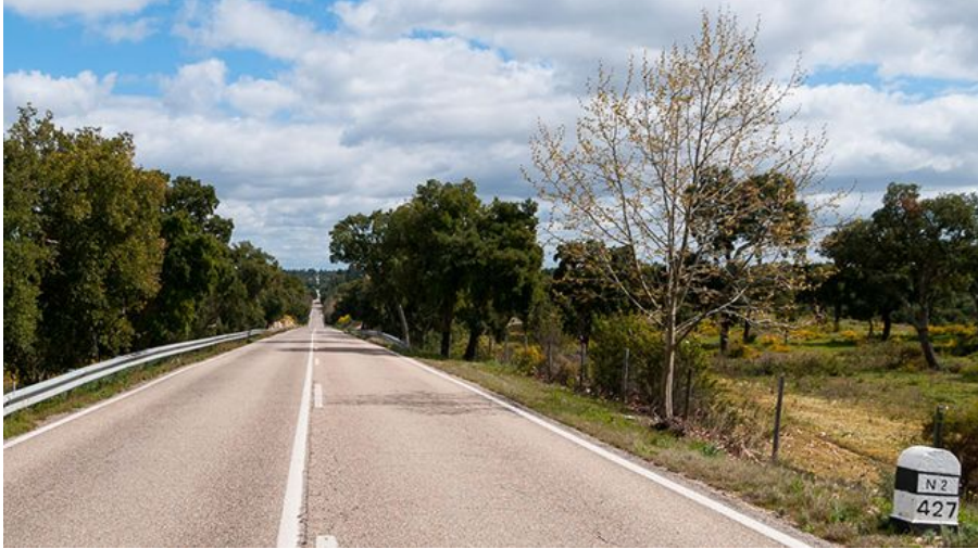
写真: Foge comigo! - Fernando Romão