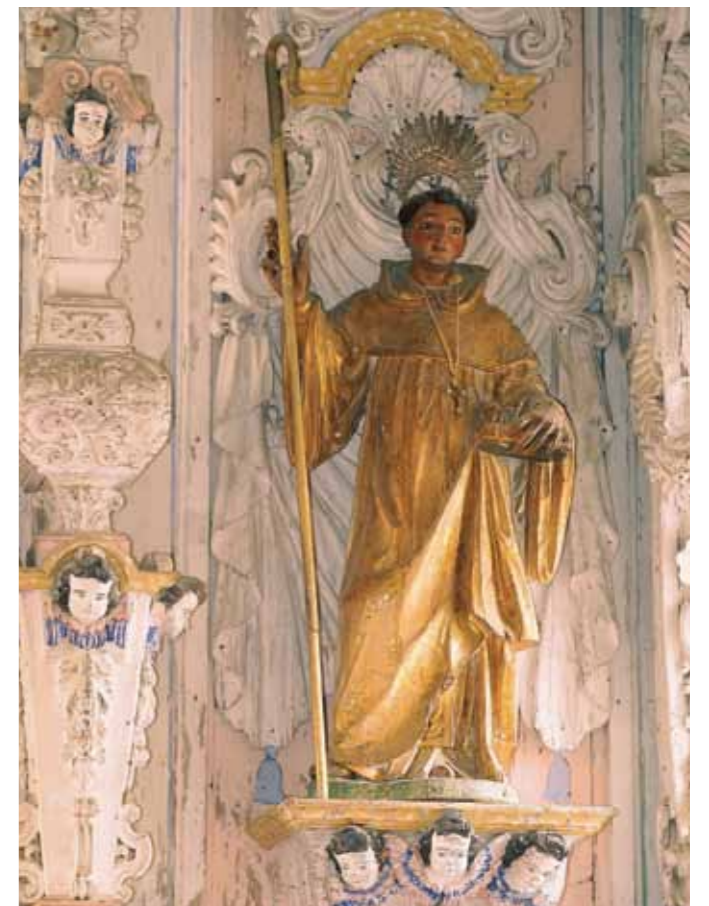
Iglesia de San Antonio, Tavira

Notamment Tavira , en raison de son vaste patrimoine religieux qui englobe plus de 20 églises, dont principalement l'église matrice Sainte-Marie, située dans le château, ou celle de la Miséricorde. À Loulé , commence le dimanche de Pâques, la Fête de la Mère de Dieu (Festa da Mãe Soberana) , qui dure 15 jours, en l'honneur de Notre-Dame-de-la-Piété (Nossa Senhora da Piedade). À Lagos , l'église baroque de Santo António , avec ses murs revêtus d'azulejos et de boiseries sculptées et dorées, est considérée comme l'une des plus belles du pays. À Almancil aussi, l'église de São Lourenço , dont les murs sont entièrement revêtus d'azulejos qui représentent des scènes de la vie de Saint Laurent, accueille de nombreux visiteurs.