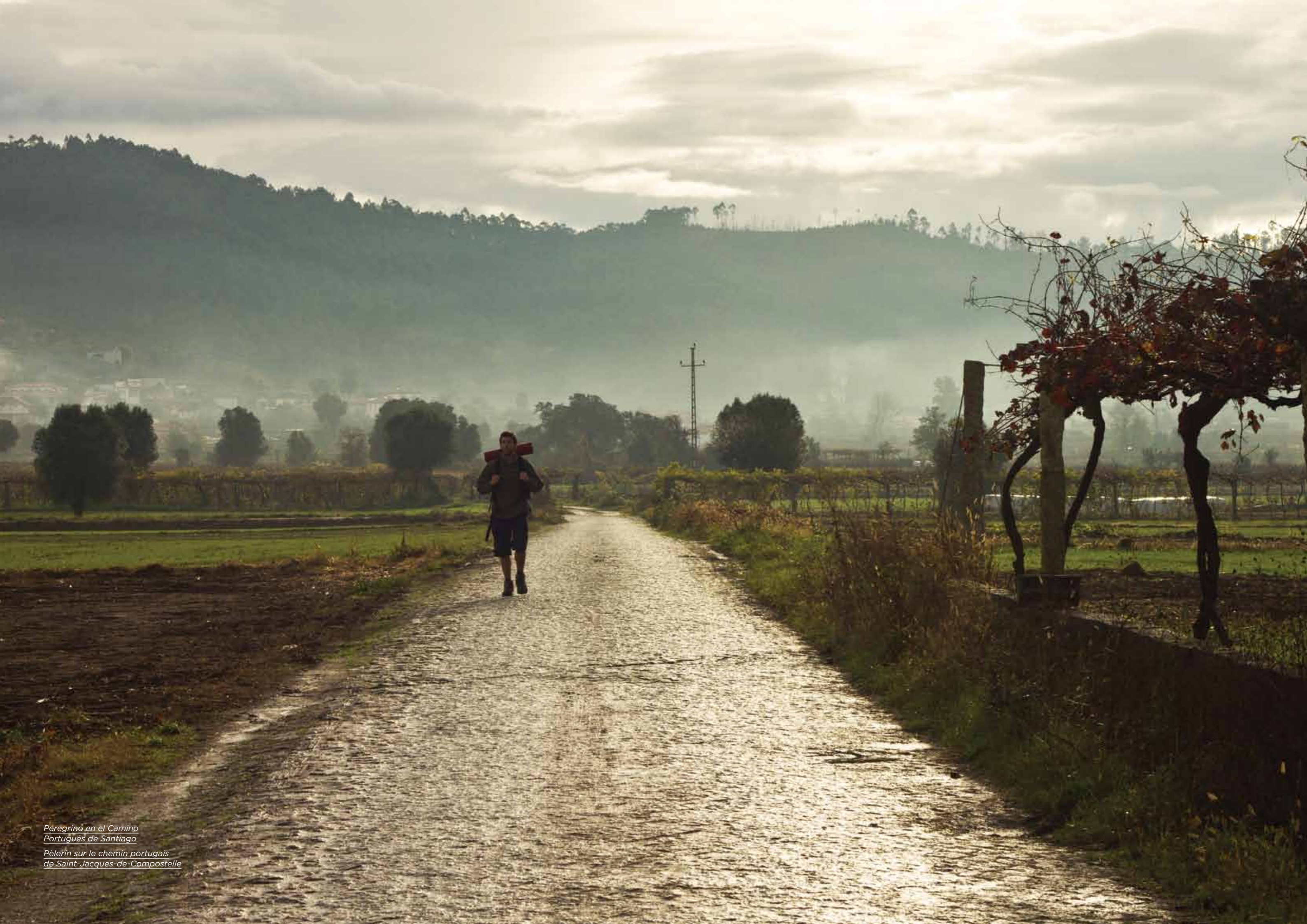
Peregrino en el Camino Portugués de Santiago Pèlerin sur le chemin portugais de Saint-Jacques-de-Compostelle