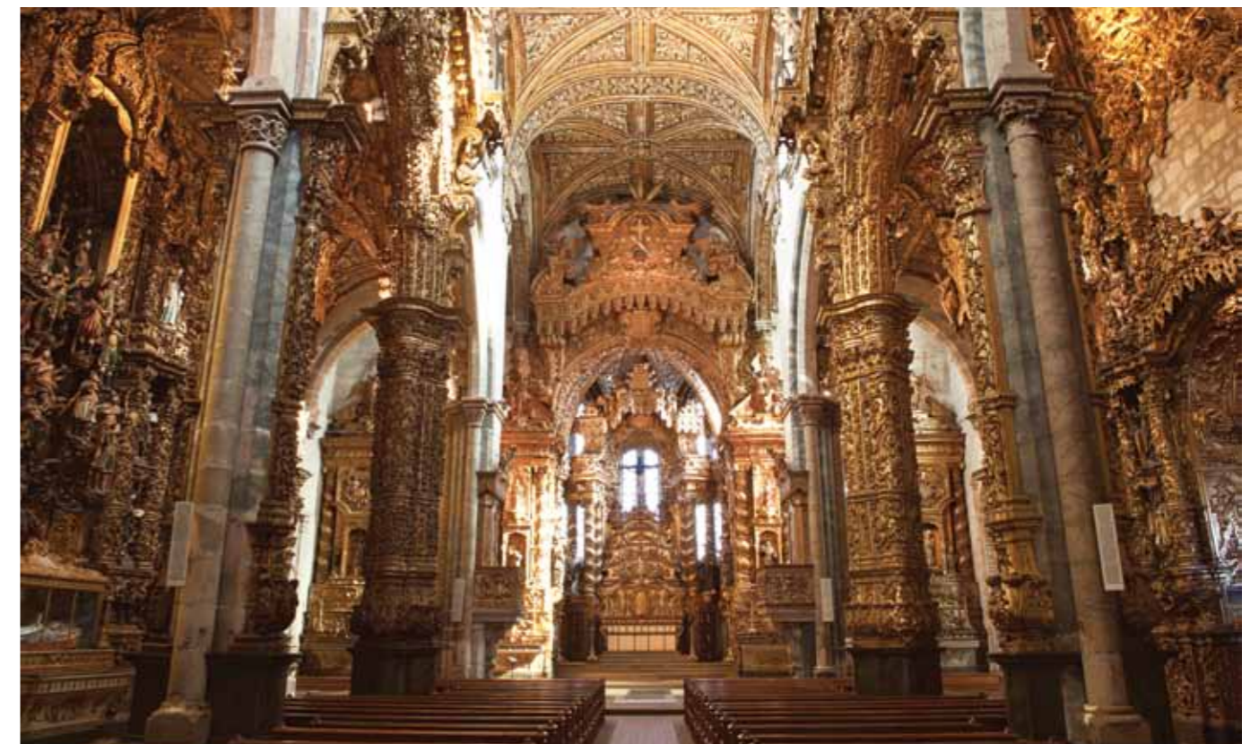
Iglesia de San Francisco, Oporto

Au Carmel de Sainte-Thérèse, vous pouvez visiter le mémorial de sœur Lúcia , la cellule où a vécu jusqu'à sa mort, en 2005, la jeune bergère témoin des apparitions de la Vierge à Fátima, en 1917. Elle y a reçu la visite du pape Benoit XVI, en 1996.