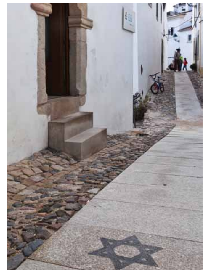
Museo Sinagoga, Castelo de Vide

Le musée occupe la synagogue dont la construction s'est déroulée entre 1430 et 1460, à la demande de l'infant Henri, la seule du XVIe siècle qui existe encore au Portugal. Après l'édit d'expulsion des juifs, en 1496, ce temple eut d'autres fonctions jusqu'en 1923, année où un juif polonais, Samuel Schwarz, l'a rénové et en a fait don à l'État portugais, afin qu'un musée y soit installé. Des fouilles archéologiques ultérieures ont mis à jour la salle du « mikvé », le bain rituel de purification.