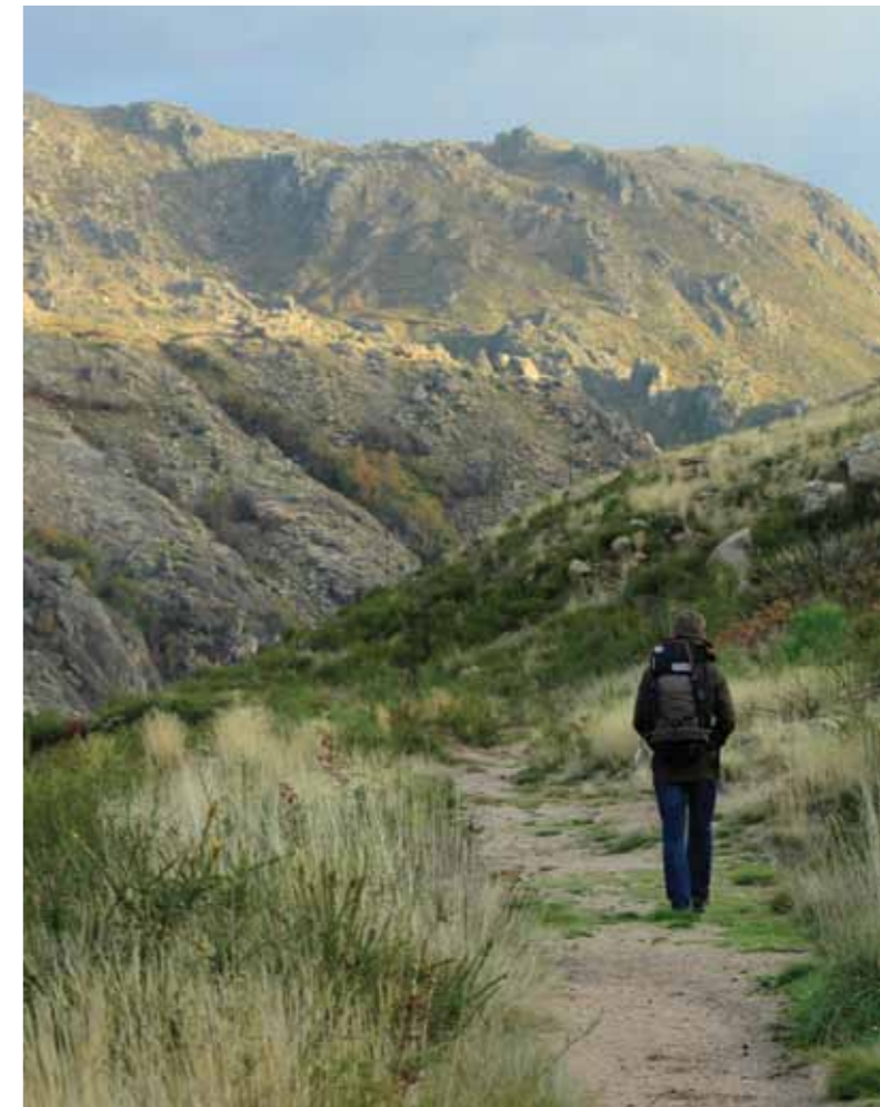
Peregrino en el Camino Portugués de Santiago

À Beja , la paroisse de Santiago Maior est une des plus anciennes et la cathédrale est aujourd'hui l'église du même nom.