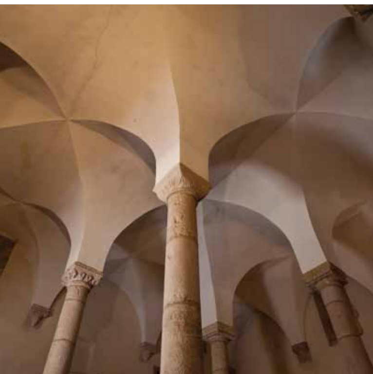
Museu Luso-Hebreo Abraham Zacuto, Tomar