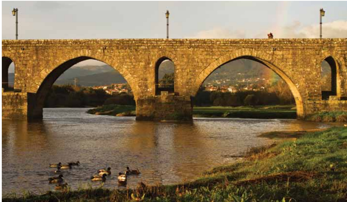
Puente Romano en el Camino de Santiago, Ponte de Lima